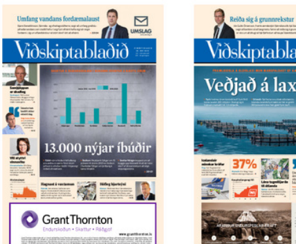
26. maí 19. maí (/tolublod/files/14126)